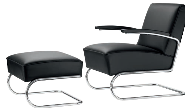
S 411 H, S 411 VOLLUMPOLSTERT FULL UPHOLSTERY