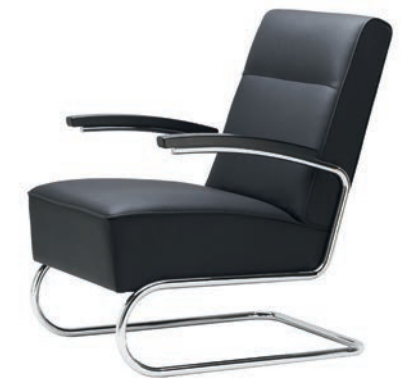
S 412 MIT HOHER RÜCKENLEHNE WITH HIGH BACKREST