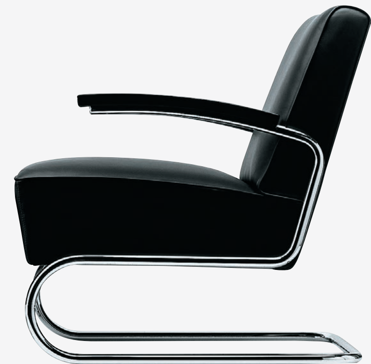
S 411 VOLLUMPOLSTERT FULL UPHOLSTERY

EN The outstanding properties of this armchair are elegance, timelessness and exceptional seating comfort. Added is a lightness that only a cantilever model can have. While the first tubular steel chairs from the 1920s were rarely upholstered, the 1935 Thonet catalogue presented an entire series of voluminously upholstered armchairs and sofas. The in-house Thonet design S 411 from the year 1932 probably marks the beginning of this new product series. Today, it is produced with high-quality upholstery. A matching footstool is available.