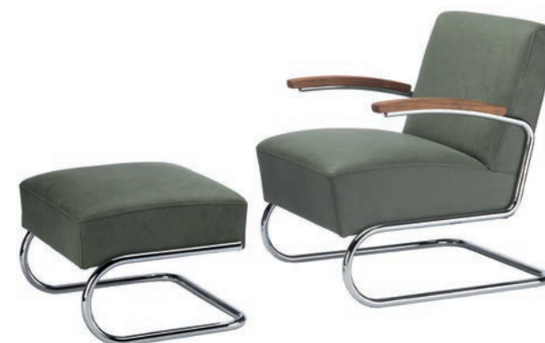
S 411 H, S 411 PURE MATERIALS