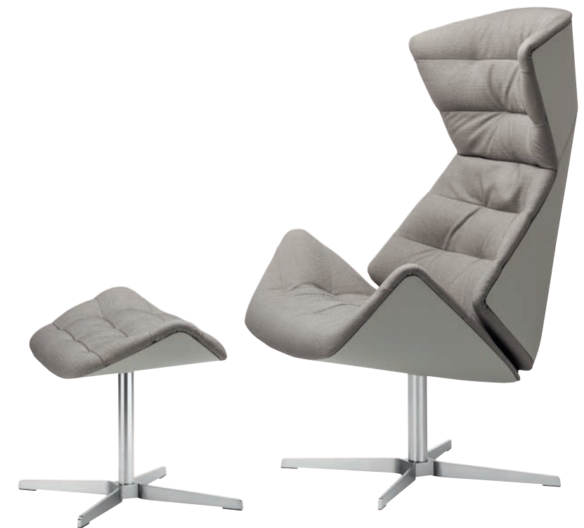
808 H, 808 GESTELL FLACHSTAHL EDELSTAHLLOPTIK/ FRAME FLAT STEEL STAINLESS STEEL DESIGN