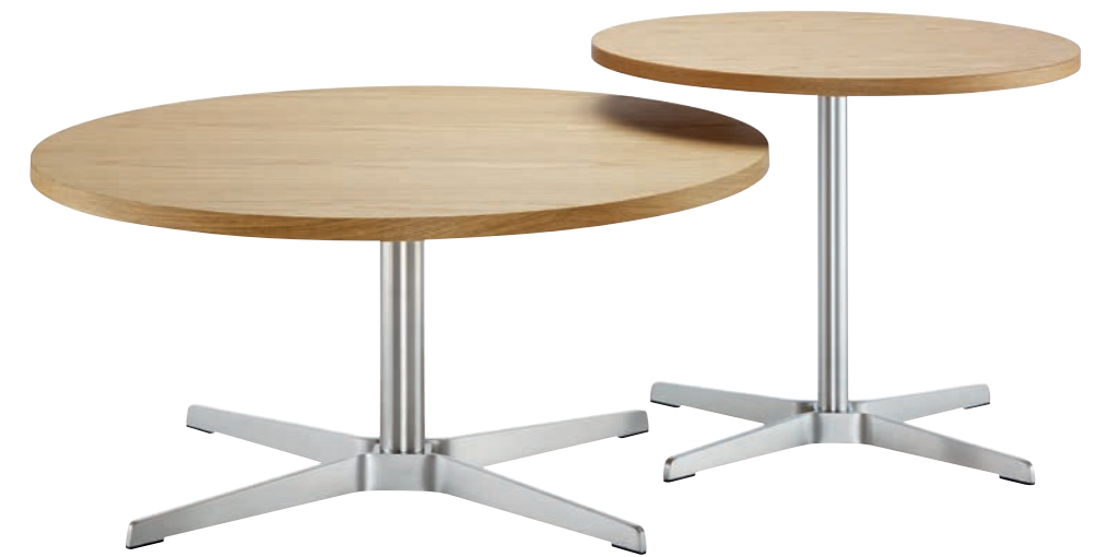
1808 TISCH NIEDRIG/TABLE LOW 1809 TISCH HOCH/TABLE HIGH GESTELLE FLACHSTAHL EDELSTAHL OPTIK, PLATTEN EICHE KLAR LACKIERT/ FRAMES FLAT STEEL STAINLESS STEEL DESIGN, TABLETOPS OAK CLEAR LACQUERED