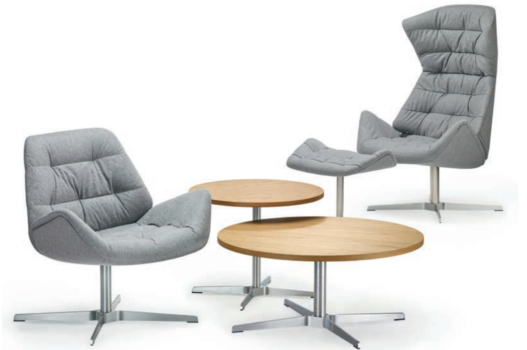
809, 1809, 1808 UND/AND 808 MIT/WITH 808 PA GESTELLE FLACHSTAHL EDELSTAHOPTIK, POLSTERUNG, PLATTEN EICHE KLAR LACKIERT/ FRAMES FLAT STEEL STAINLESS STEEL DESIGN, UPHOLSTERY, TABLETOPS OAK CLEAR LACQUERED

The compact lounge chair 809 functions as a “small brother” of the successful lounge chair 808, and as a place of retreat in smaller rooms or in groups, and in combination with the larger chair or the low side tables 1808 and 1809. A footstool rounds off the range.