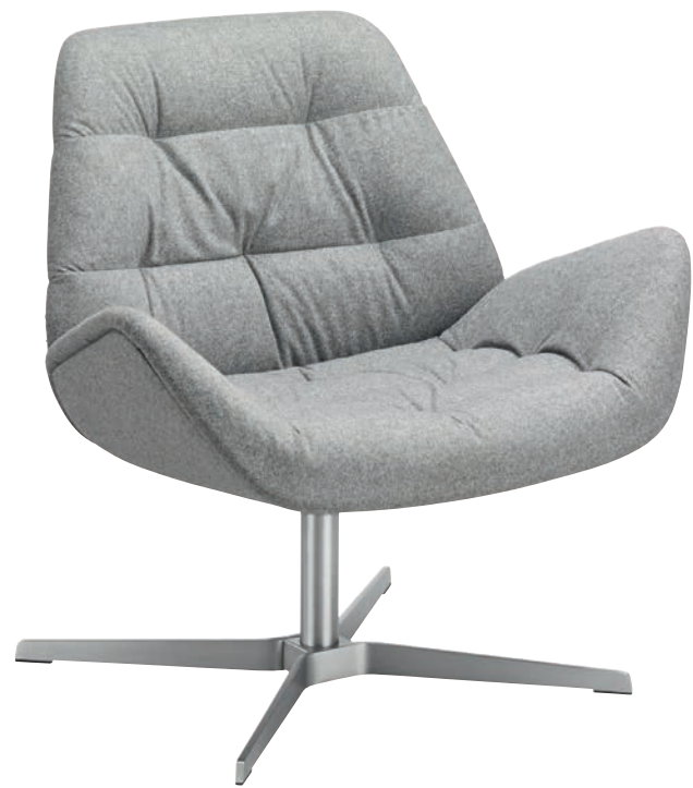
809 GESTELL FLACHSTAHL EDELSTAHOPTIK POLSTERUNG/FRAME FLAT STEEL STAINLESS STEEL DESIGN, UPHOLSTERY